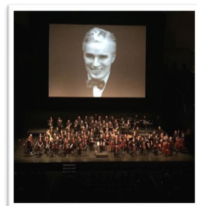
Salut final de l'orchestre et de Chaplin !

Si vous souhaitez avoir un aperçu de cette soirée inoubliable, cliquez ici