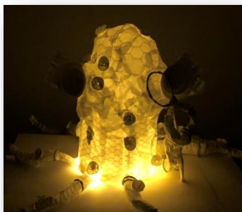
L'orpailleuse des mers