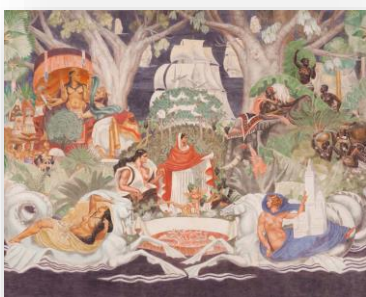
Fresque centrale - hall du MNHI