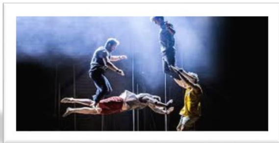
Gravity and other myths Backbone - La Villette